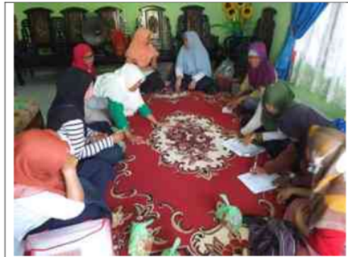
Gambar 2 Penyuluhan tentang PSN kepada peserta

Kader yang menjadi peserta dalam pengabdian masyarakat ini hampir seluruhnya (94%) perempuan. Sebagian besar responden (71%) berusia lebih dari 45 tahun dan sebagian besar (59%) berpendidikan menengah. Informasi ini dapat dilihat pada Tabel 1.