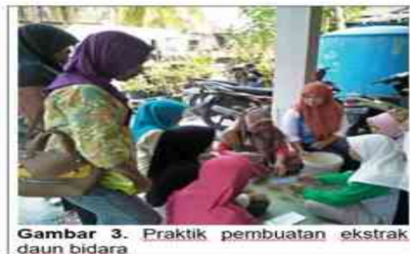
Gambar 3. Praktik pembuatan ekstrak daun bidara

Penyuluhan merupakan salah satu bentuk pendidikan untuk meningkatkan pengetahuan masyarakat (Sugiarto et al., 2022). Walaupun kader kesehatan telah melaksanakan secara rutin program pemerintah, peningkatan pengetahuan kader tetap diperlukan (Miryanti et al., 2016). Hal ini mengingat ilmu pengetahuan yang cepat berkembang. Di samping itu, penyegaran ilmu diperlukan sebagai sarana mengulang kembali materi yang pernah diperoleh yang pada akhirnya dapat meningkatkan kinerja kader (Angelina et al., 2020). Praktik pembuatan ekstrak daun bidara dilakukan secara langsung dengan memanfaatkan alat yang tersedia di rumah tangga. Hal ini dimaksudkan agar kader dapat membuat sendiri ekstrak tersebut. Kegiatan praktik pembuatan ekstrak dapat dilihat pada Gambar 3.