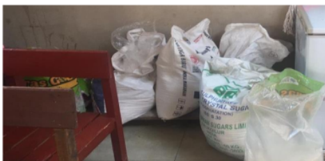
Gambar 1. Tempat penyimpanan bahan makan kering