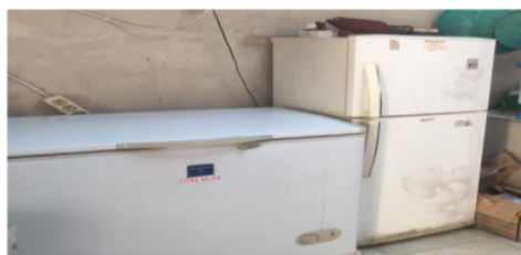
Gambar 2. Tempat penyimpanan bahan makan segar/basah

Terlihat bahwa unit makan tidak memiliki gudang khusus untuk penyimpanan makanan kering dan basah/mudah rusak. Hal ini dikarenakan unit operasi sendiri hanya memiliki satu ruang operasi yang biasa disebut dengan dapur umum. Namun pihak dapur juga mengklarifikasi bahwa tidak ada bahan makanan yang perlu disimpan ke dalam tempat penyimpanan bahan makanan segar karena bahan makanan segar yang sudah dibeli langsung diolah semua pada hari itu, walaupun ada sisa bahan makanan segar yaitu berupa sayuran yang disimpan di tempat chiller/pendingin.