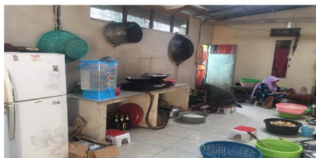
Gambar 3. Bangunan Fisik tempat penyimpanan bahan makanan kering

Bangunan fisik tempat penyimpanan bahan makanan kering masih belum maksimal. Artinya, masih lembab, tidak mudah dibersihkan dan tidak bebas serangga. Hal ini juga dipengaruhi dari bangunan (dapur umum) yang dioperasikan untuk semua kegiatan penyelenggaraan (misal: kegiatan pengolahan bahan makanan) yang mana mempengaruhi kondisi bangunan menjadi lembab, serta kondisi kurang mudah di bersihkan berkaitan dengan tata letak penyimpanan bahan makanan kering yang tidak teratur dan pintu bangunan sering tidak tertutup, memungkinkan serangga mudah masuk.