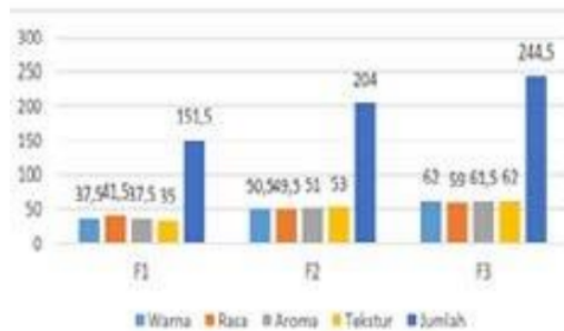
Gambar 6. Jumlah Kesukaan Warna, Rasa, Aroma, dan Tekstur Keju

Hal ini sejalan dengan penelitian yang dilakukan Yulneriwarni et al (2009) yang menyatakan bahwa perbedaan nilai tekstur yang dihasilkan pada masing-masing keju selain dipengaruhi oleh asam laktat dari lemon yang dihasilkan dalam fermentasi susu juga ditentukan oleh kandungan protein yang terdapat pada kacang dan susu. Tekstur keju juga dapat dipengaruhi oleh kadar air. Air merupakan komponen penting dalam bahan pangan karena air dapat mempengaruhi kekerasan, penampakan, citarasa dan nilai gizinya. Hal ini juga sejalan dengan penelitian yang dilakukan Wardhani, Jos, dan Cahyono (2018) jika tingkat keasaman lebih tinggi maka terjadi pelepasan air dalam keju dan terjadi penggumpalan molekul kasein dan membentuk curd sehingga semakin tinggi tingkat keasaman maka semakin baik curd yang dihasilkan.