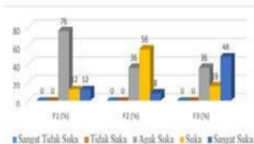
Gambar 3. Penilaian Panelis Terhadap Rasa

Berdasarkan dari hasil uji organoleptik yang dilakukan oleh panelis terhadap rasa keju substitusi sari kacang hijau, persentase tertinggi dengan tingkat kesukaan “Agak Suka” yaitu pada 1 dengan tingkat agak suka sebesar 76%, sedangkan untuk persentase terendah pada formulasi 2 dan 3 sebesar 36%.