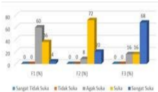
Gambar 5. Penilaian Panelis Terhadap Tekstur

Hal ini juga didukung dari hasil penelitian yang dilakukan Rakhmah dan Suryani 2017 hal ini disebabkan oleh aroma lemon pada perlakuan formula yang diberi komposisi lemon yang agak tinggi sangat disukai panelis. Menurut Arifin (2006) bahwa aroma lemon ini dikarenakan lemon mengandung limonin . Limonin adalah jenis komponen kimia dalam minyak atsiri berupa terpen, senyawa ini memiliki wangi dan aroma khas lemon.