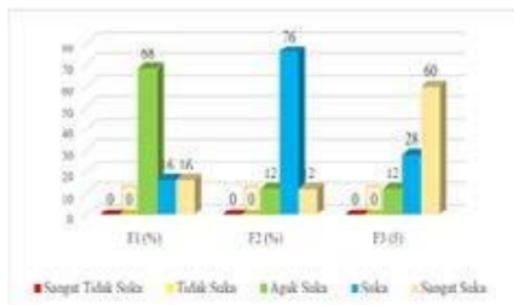
Gambar 2. Penilaian Panelis Terhadap Warna

Berdasarkan dari hasil uji organoleptik yang dilakukan oleh panelis terhadap rasa keju substitusi sari kacang hijau, persentase tertinggi dengan tingkat kesukaan “Suka” yaitu pada formulasi 2 sebesar 76%, sedangkan untuk persentase terendah terdapat formulasi 3 sebesar 28%. Berdasarkan uji statistik Friedman yang disempurnakan Conover dengan tingkat kepercayaan 95% menunjukkan bahwa hasil T hitung > F tabel (13,4 > 3,19) maka dapat disimpulkan bahwa ada pengaruh variasi formulasi yang berbeda terhadap warna Keju.