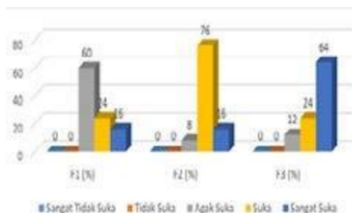
Gambar 4. Penilaian Panelis Terhadap Aroma

Berdasarkan dari hasil uji organoleptik yang dilakukan oleh panelis terhadap rasa keju substitusi sari kacang hijau, persentase tertinggi dengan tingkat kesukaan “Suka” yaitu pada formulasi 2 sebesar 76%, sedangkan untuk persentase terendah terdapat pada formulasi 1 dan formulasi 3 sebesar 24%. Berdasarkan uji statistik Friedman yang disempurnakan Conover dengan tingkat kepercayaan 95% menunjukkan bahwa hasil T hitung > F tabel (10,51 > 3,19) maka dapat disimpulkan bahwa ada pengaruh variasi formulasi yang berbeda terhadap tekstur Keju.